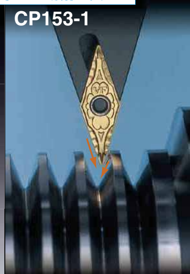
Vプーリー V Pulley

Good Chip Control for Variable D.O.C ( Undercutting and Profiling )