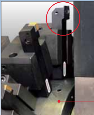
刃物台ドラム Tool post drum