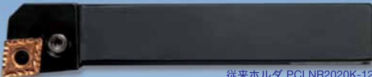
従来ホルダ PCLNR2020K-12 Conventional tool holder