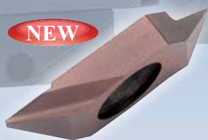
あとびき Back turning