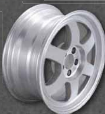
アルミホイール用 for Aluminum Wheel