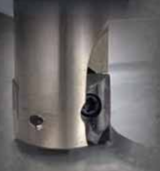
エンドミルMEC型用 for Endmill MEC-Type