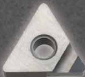
ニューバリューエッジ New Value Edge