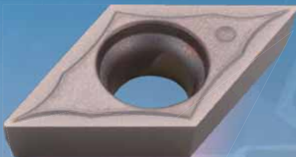
低～高切込み対応 GQ ブレーカ Applicable to both small and large D.O.C

Applicable to wide range of precision required cutting