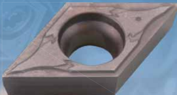
仕上げ用 GF ブレーカ For finishing